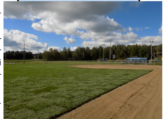
Réfection Terrain de baseball