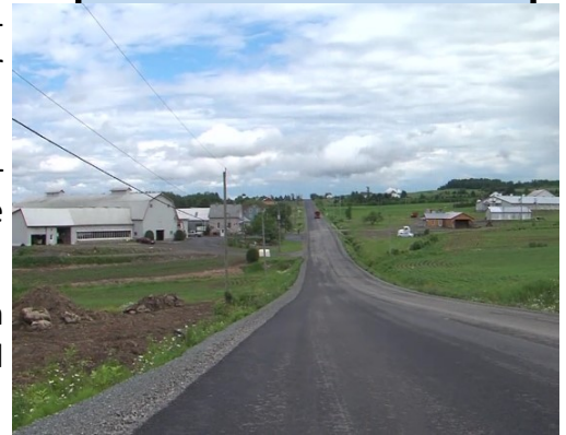
Asphalte rang Huit Ouest