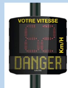
Afficheur de vitesse