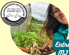
Entreprises MJ Poulin