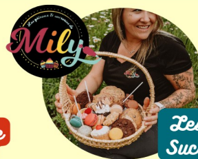
Les Gâteaux et Sucrerie de Milly