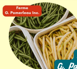
Ferme G. Pomerleau Inc.