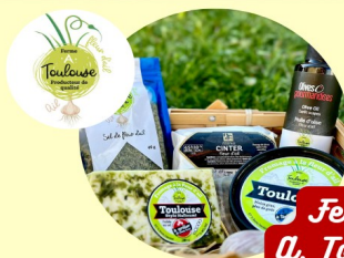
Ferme A. Toulouse