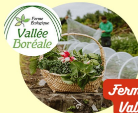
Ferme Écologique Vallée Boréale